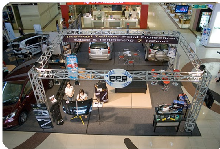
Pameran tunggal PPS Autoshine 2010, Mal of Olympic Garden, Malang