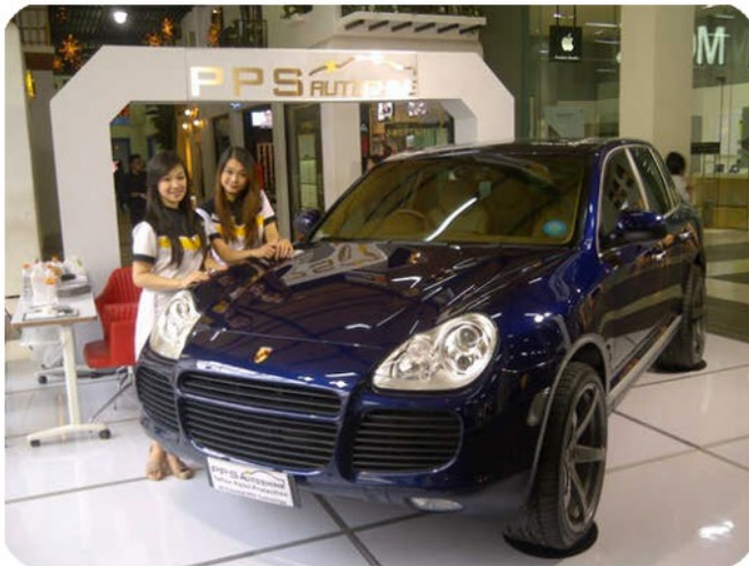
Pameran bersama Porsche 2012, Paris Van Java, Bandung

Mencari jalur pemasaran yang efektif, murah dan sesuai target pasar PPS