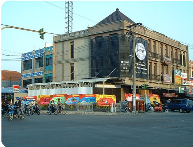
Tampak luar workshop PPS Nginden Surabaya Timur