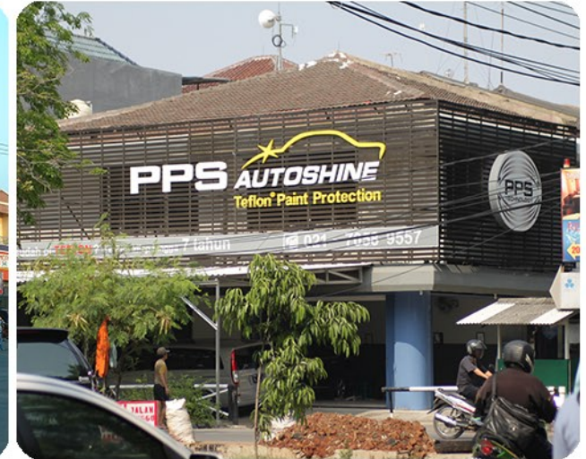
Tampak luar workshop PPS Sunter Jakarta Utara