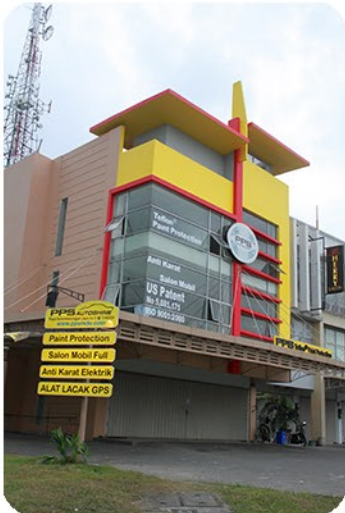
Gedung PPS Indonesia Surabaya Barat