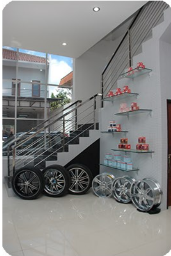
Ruang display produk PPS Samarinda